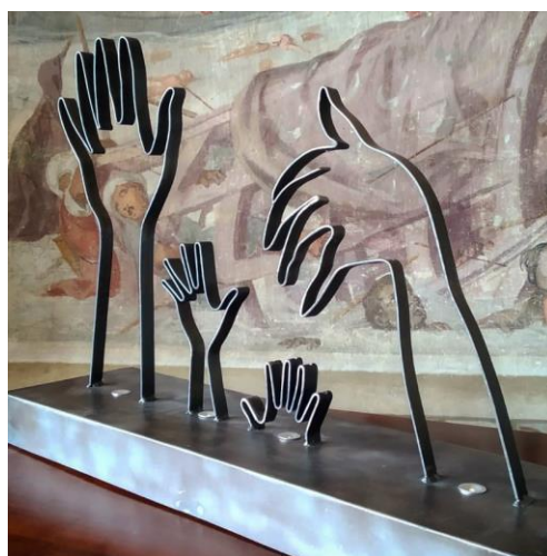
Villa Barbarigo (Noventa Vicentina)