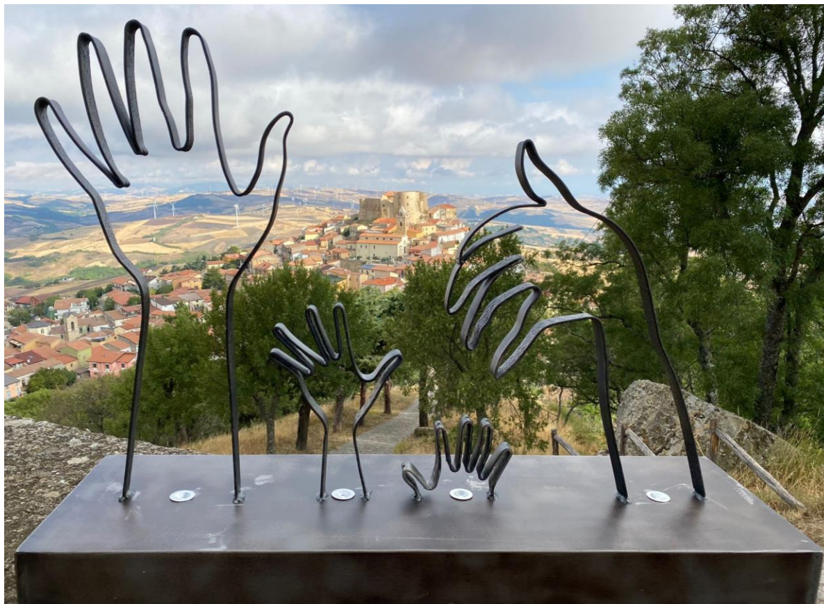
Monteverde, 2021 (Panorama da Serro Croce sullo sfondo del Castello)