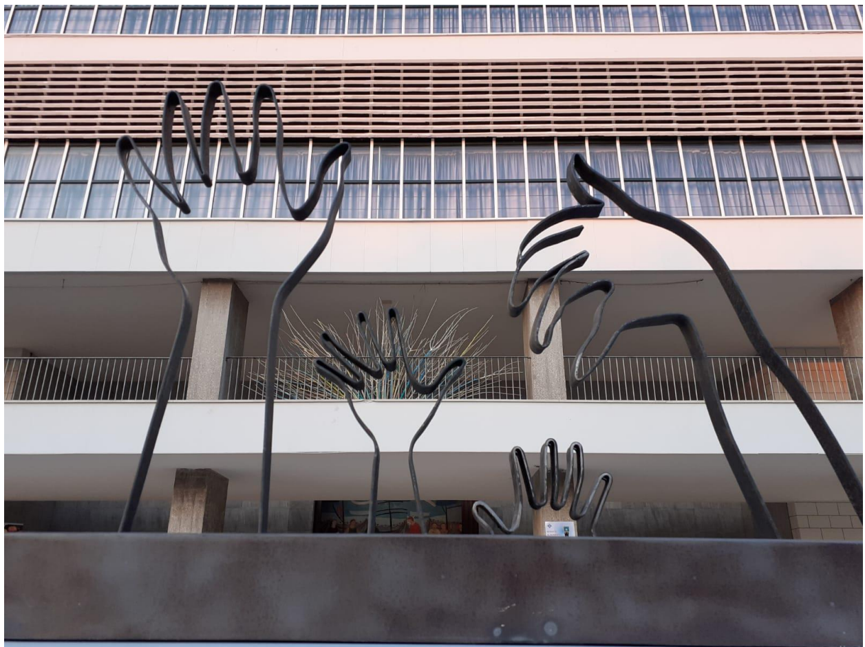
Colonia Agip, Cesenatico