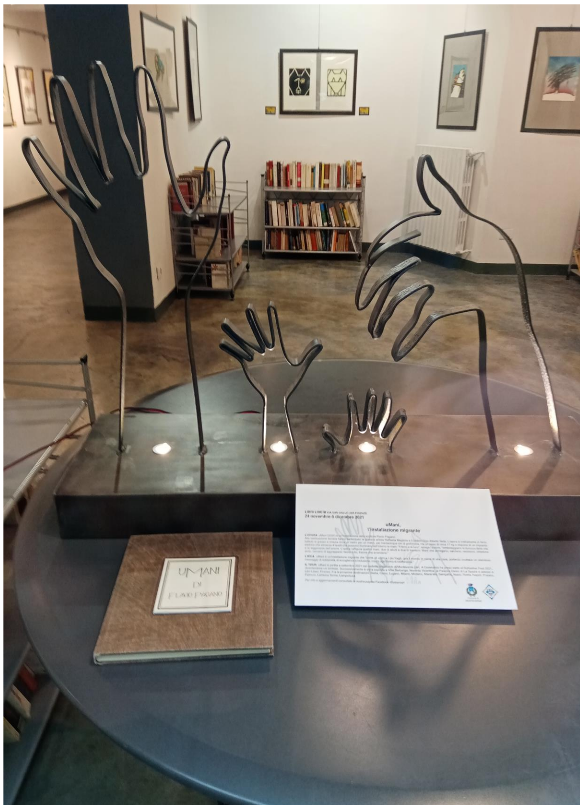
Galleria Libri Liberi, Firenze