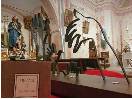
Basilica di San Rocco, Rodallo (TO)