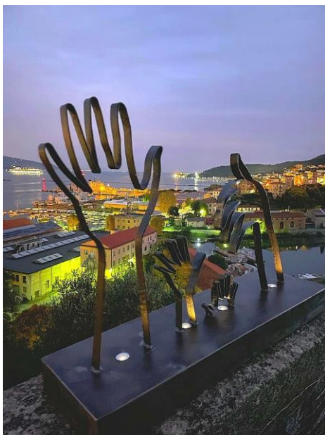
Golfo dei Poeti, Spezia