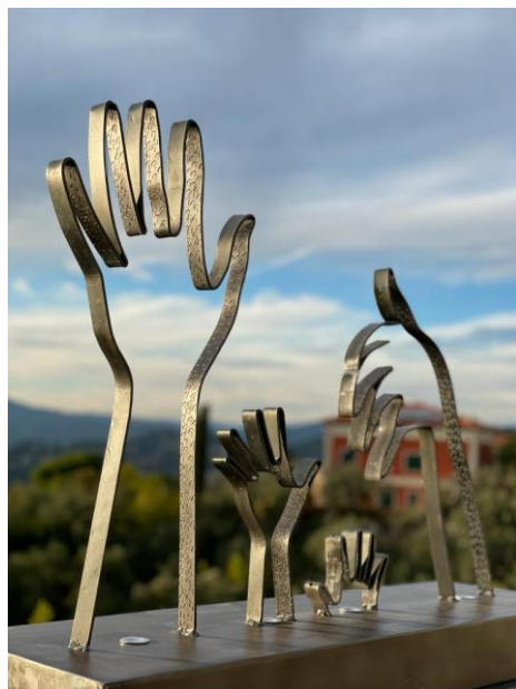
Palazzo Gromo Losa, Biella