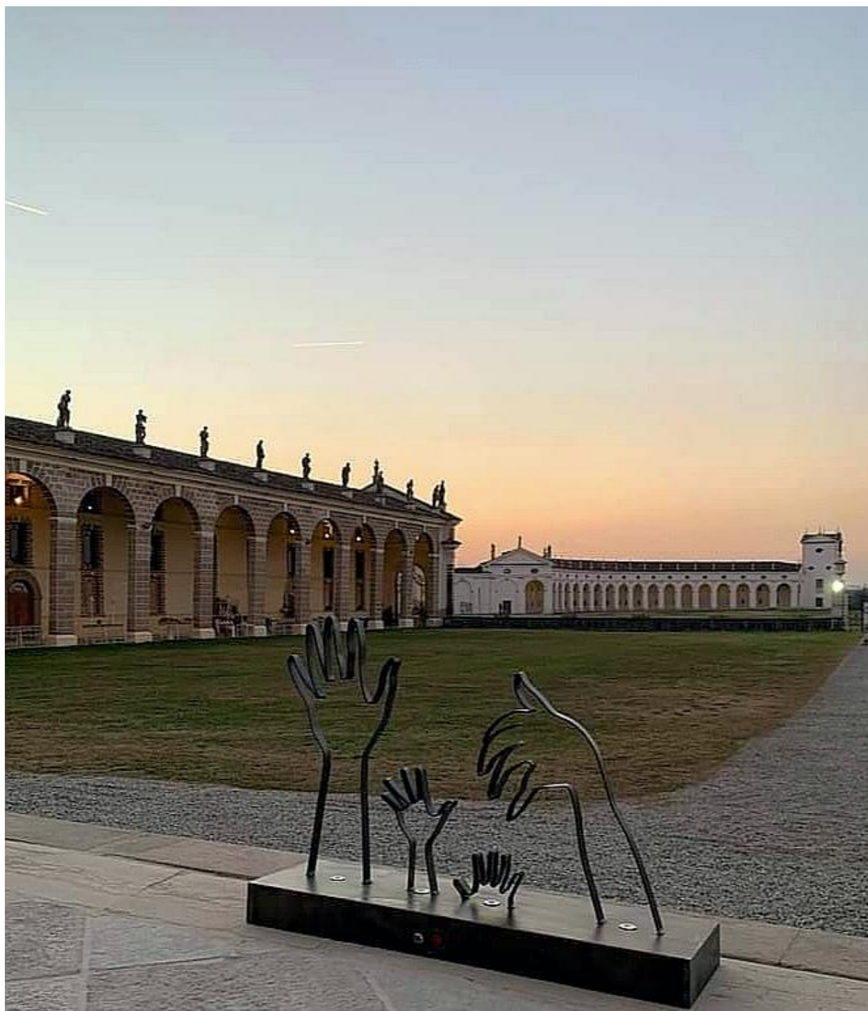
Villa Manin, Codroipo (UD)