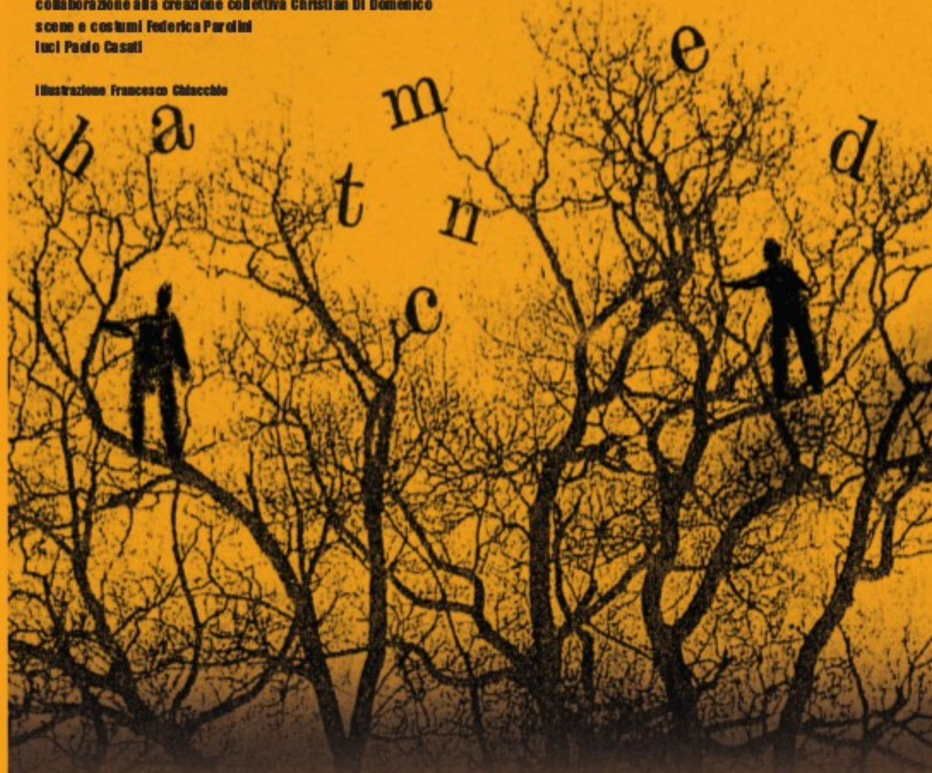
Illustrazione Francesco Chiacchio

con Nunzia Antonino, Michele Cipriani, Franco Ferrante, Paola Fresca collaborazione alla creazione collettiva Christian Di Domenico scene e costumi Federica Parolini lucci Paolo Casati